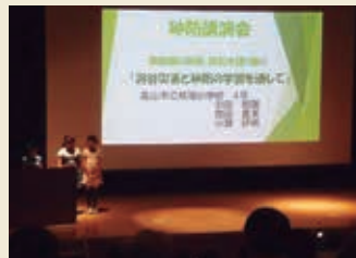
砂防講演会での発表