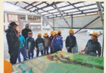
土石流模型実験装置で砂防施設の機能を説明