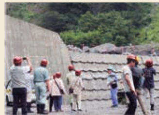
防災学習村ツアー

防災広報誌の発行や防災啓発インフラツアーの企画運営など、地域住民や広く一般への啓発活動、地元小学校での砂防教室実施など地域防災の担い手育成、土砂災害発生時の住民等救助活動支援、砂防設備の草刈りや特定外来生物（植物）オオハongoソウの除去など施設維持管理・環境保全、地域づくりのための活動などを継続的かつ精力的に取り組まれています。