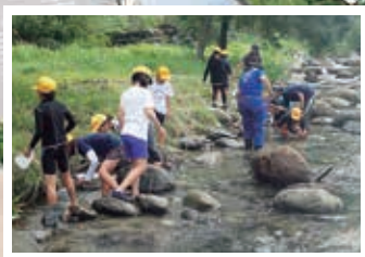
水生生物調査(栃尾小学校4年生)