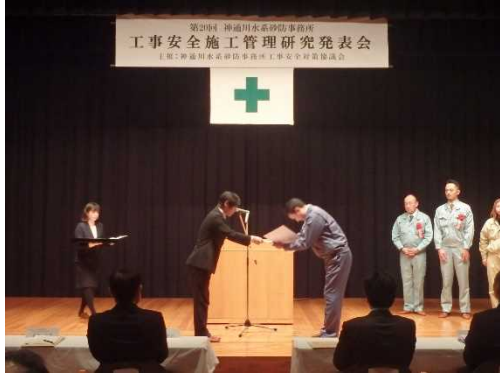
▲昨年度の表彰式の状況