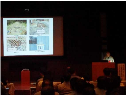
▲昨年度の論文発表状況