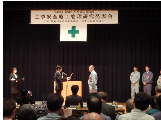
▲昨年度の表彰式の状況