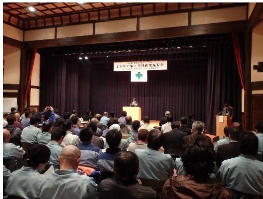
▲昨年度の論文発表状況