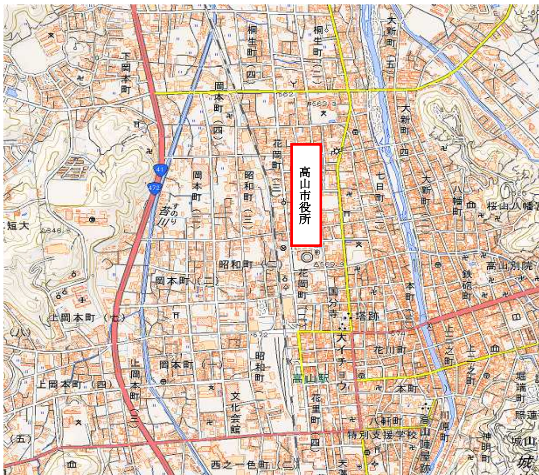
高山市本庁舎 地下一階