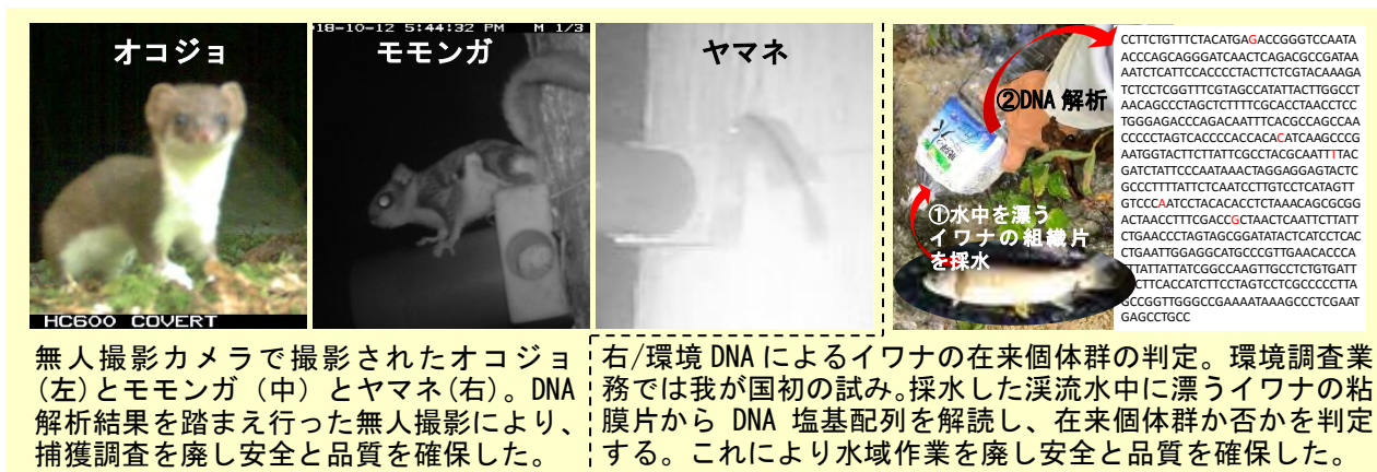
図—5 最新調査技術・DNA 解析、撮影技術を駆使した間接的調査技術の例

これらの技術はまだ万能ではありませんが、引き続き技術開発を継続して適用範囲を広げ、品質の向上とともに安全性の確保に繋げていきたいと考えています。