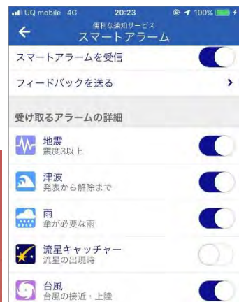
図—4 ICT デバイスを用いた安全管理の一例