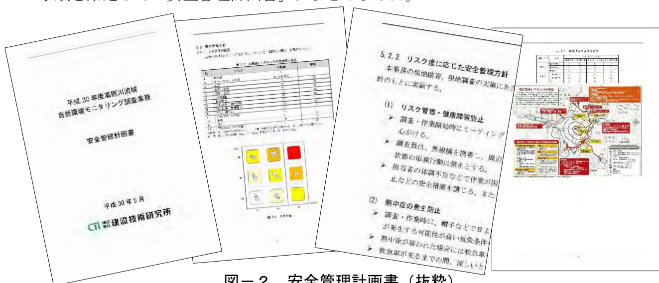
図－2 安全管理計画書（抜粋）

本業務では、この点について重点的に対策を講じていくよう工夫をし、安全管理手順を策定して「安全管理計画書」にまとめました。