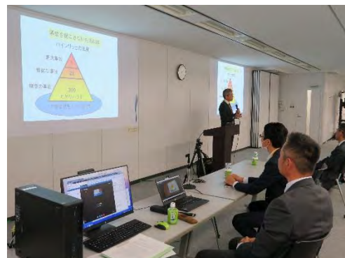
図－3 安全管理講習の様子