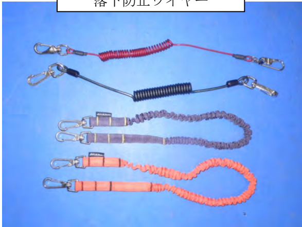
落下防止ワイヤー