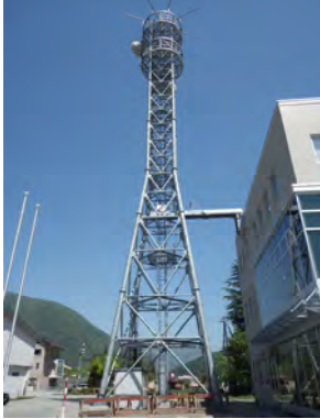
神通川水系砂防事務所 (41m)