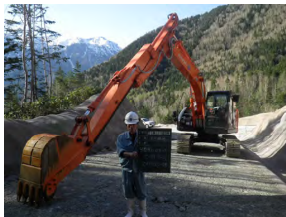
床堀状況(最深部床堀)