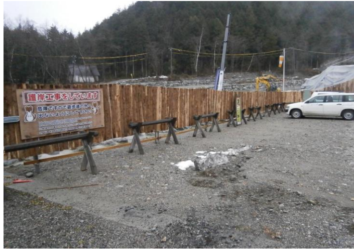
(間伐材利用の立入防止の木柵)

この為、施工箇所となる新穂高ロープウェイの下段、上段の駐車場に間伐材を使用した木柵を延長設置し、工事箇所と駐車場を完全に分離し公衆災害や第三者災害の発生を防止している。