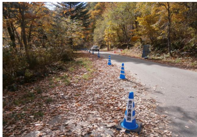
(カラーコーンによる歩行者通路設置)

新穂高第2駐車場からの市道を通行中の歩行者、登山者と車道をカラーコーンで区分し分離すると共に歩行者通路看板、徐行看板、駐車禁止看板を設置した。