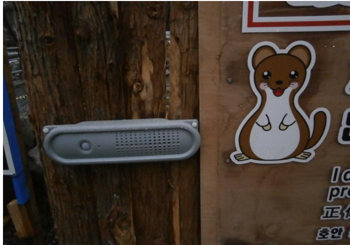
(赤外線センサーによる音声案内機の設置)

観光客が多数利用する新穂高ロープウェイ裏のバスターミナルや穂高連峰への登山道の途中にある工所用道路出入口付近に赤外線センサーによる音声案内機を設置し、登山者及び観光客に音声により(危険です。立入らないで下さい等)工事箇所への立入り禁止等注意を呼びかけ公衆災害を防止に努めている。