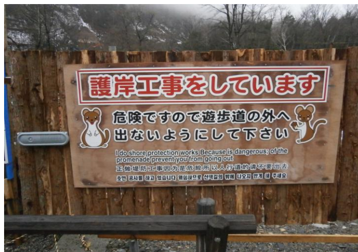
(4ヶ国語標記看板の設置)

よって駐車場を利用する外国人も分かる規制看板を工事箇所周辺に設置し、無用な立入りをしないよう4ヶ国語(日本語・英語・中国語・韓国語)標記の看板により注意喚起を図っている。