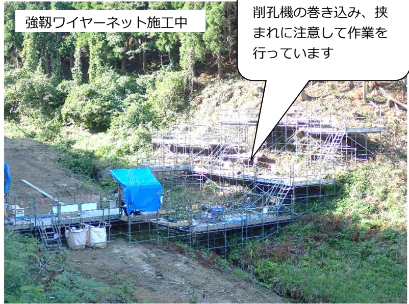
強靱ワイヤーネット施工中