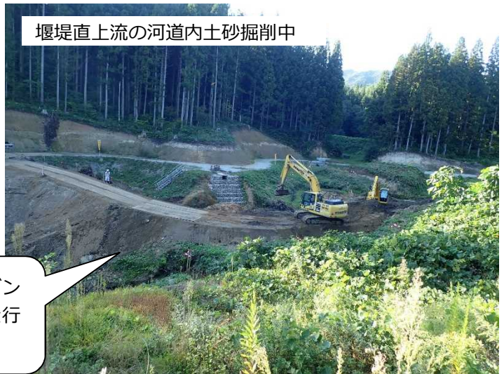
堰堤直上流の河道内土砂掘削中

重機の旋回半径内に人が入らないようにする、ダンプトラックの転落防止のため、後退時には誘導を行う等、徹底しています