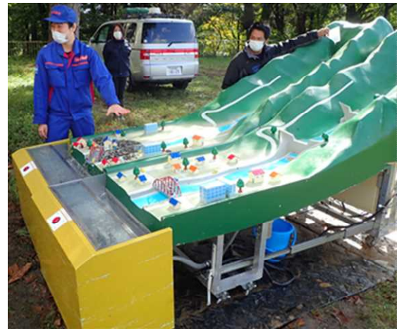
【参考】土石流模型実験による説明