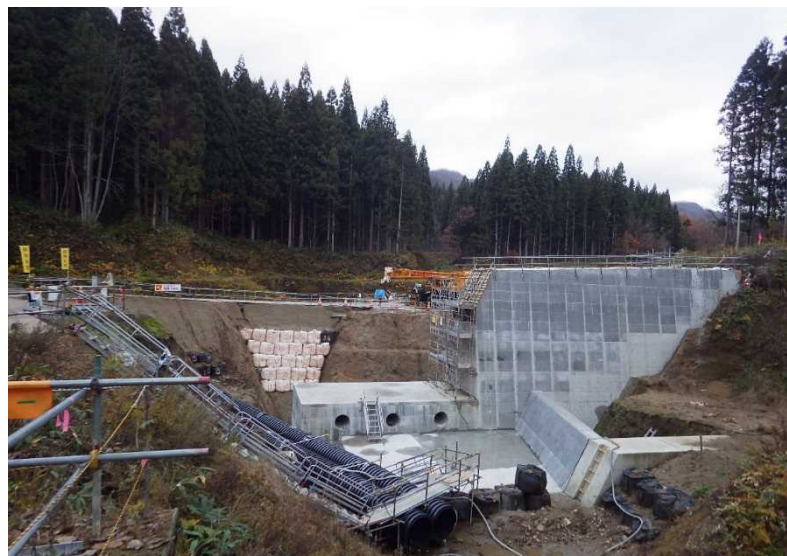
平成30年11月29日本堤工、側壁工、水叩き工コンクリート打設完了状況

今回の施工分のコンクリート打設が完了しました。今後、埋め戻しを行い、今回工事の完成です。