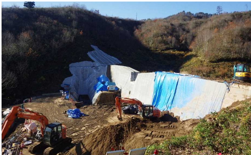
平成30年12月2日全景写真

平成30年12月上旬 本堤工のコンクリート打設が完了し、本堤工の埋め戻しと前庭工の掘削を行っています。