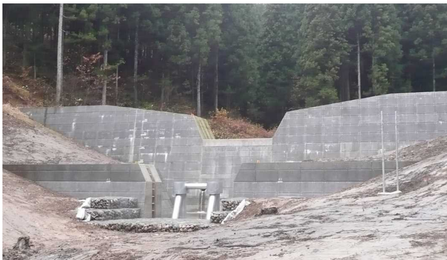
平成30年12月4日前庭保護工完了状況

穴沢2号砂防堰堤の前庭保護工が完了しました。この後、銘板、看板を取り付けて、穴沢2号砂防堰堤の完成です。