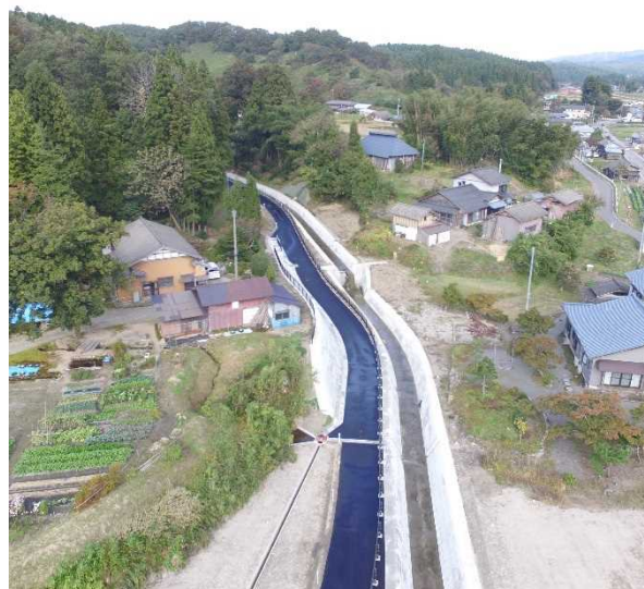
平成30年10月24日坂井川取り付け部～流路工及び市道横山2号線完成状況