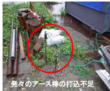
発々のアース棒の打ち込み不足