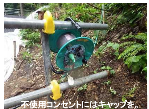
不使用コンセントにはキャップを。