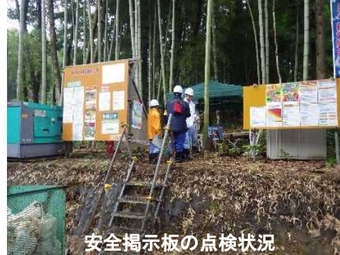
安全掲示板の点検状況