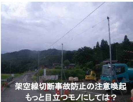
架空線切断事故防止の注意喚起 もっと目立つモノにしては？