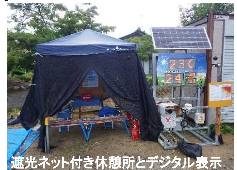
遮光ネット付き休憩所とデジタル表示