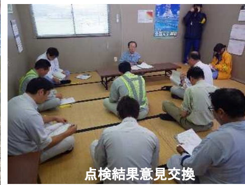
点検結果意見交換