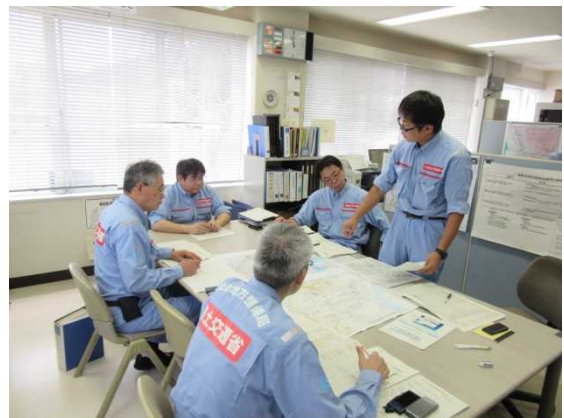
対策工法についての説明