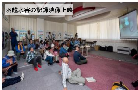
羽越水害の記録映像上映