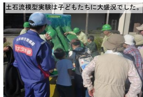
土石流模型実験は子どもたちに大盛況でした。