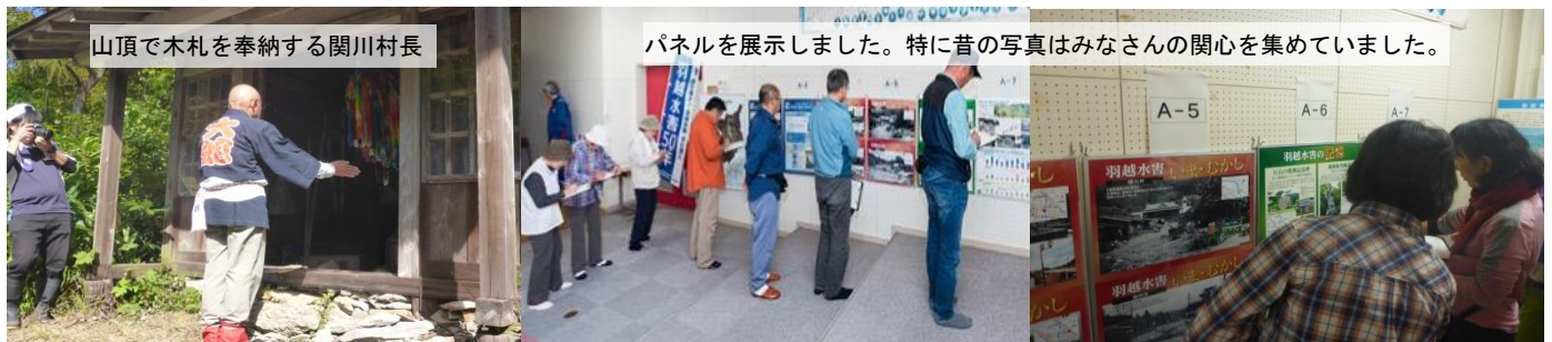
山頂で木札を奉納する関川村長

各企画をご覧になった方からは「模型実験から砂防堰堤の大切さがわかった。」「羽越水害を語り継ぐことが大切!」等、貴重なご意見をいただきました。