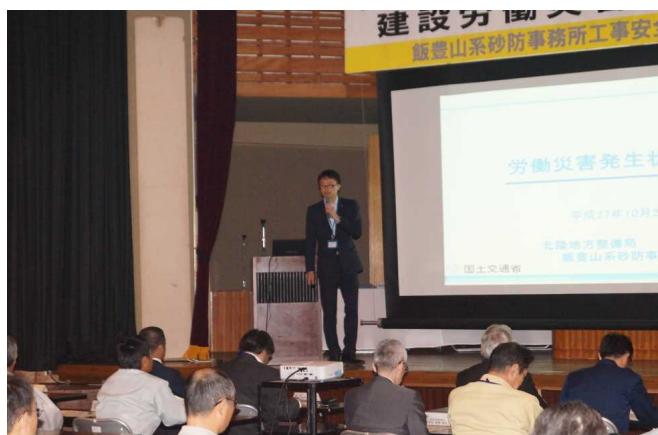
工事事故の発生状況と安全管理について