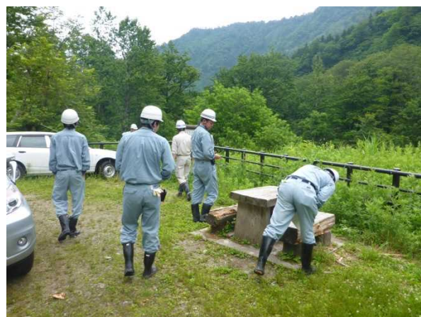
梅花皮沢第4号砂防堰堤下流広場