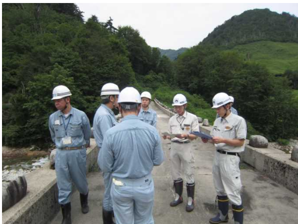
玉川スーパー暗渠砂防堰堤