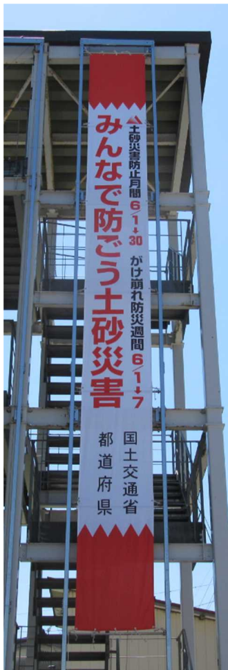
垂れ幕設置（事務所）

各市町村で1週間にわたり展示をお願いしており、1週目（6月1日～5日）は胎内市、2週目（6月8日～12日）は新発田市、3週目（6月15日～19日）は関川村で展示を終え、現在は小国町役場ロビーで26日（金）まで展示していますので、ご覧頂ければと思います。