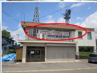
垂れ幕設置（出張所）