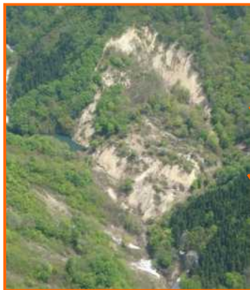
写真-大規模土砂崩壊