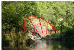
写真-上流溪岸部の崩壊状況