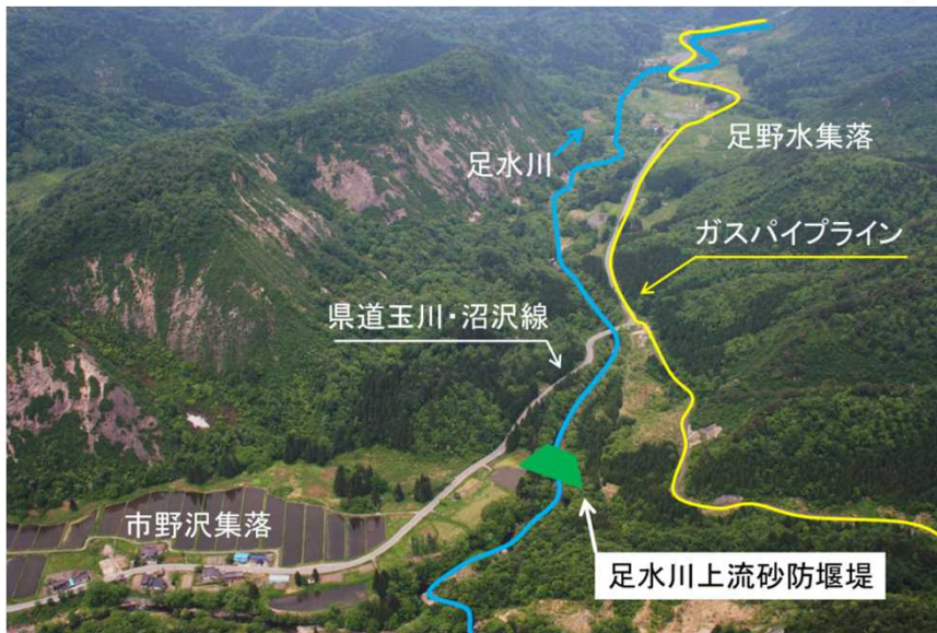
写真-流域概要（足水川上流砂防堰堤）