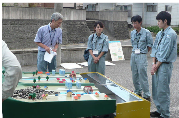
模型実験での学習の様子