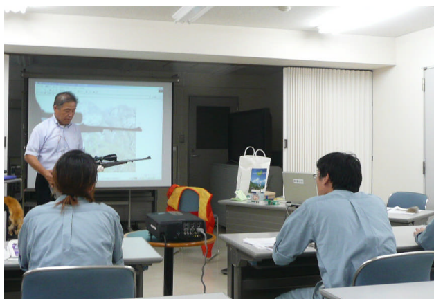
マタギ文化の講義の様子