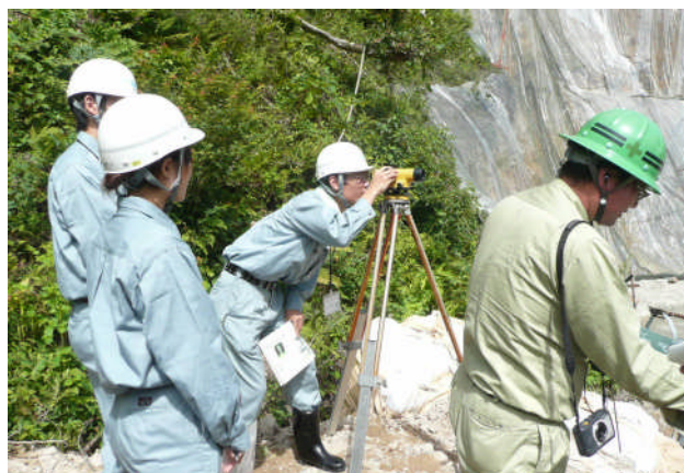
実際の現場で測量を体験の様子