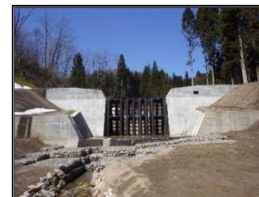
穴沢第1号砂防堰堤