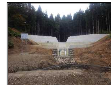
穴沢第3号砂防堰堤