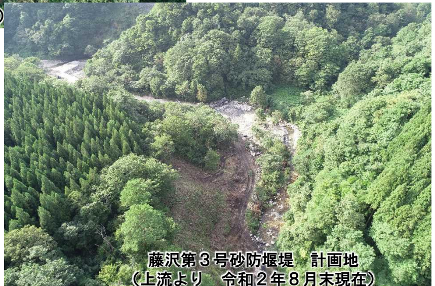
藤沢第3号砂防堰堤 計画地 (上流より 令和2年8月末現在)