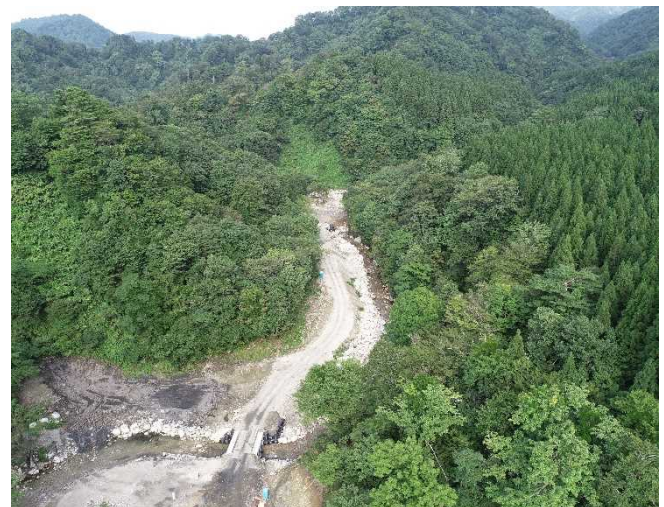
工事用道路上流部 (令和2年8月末現在)