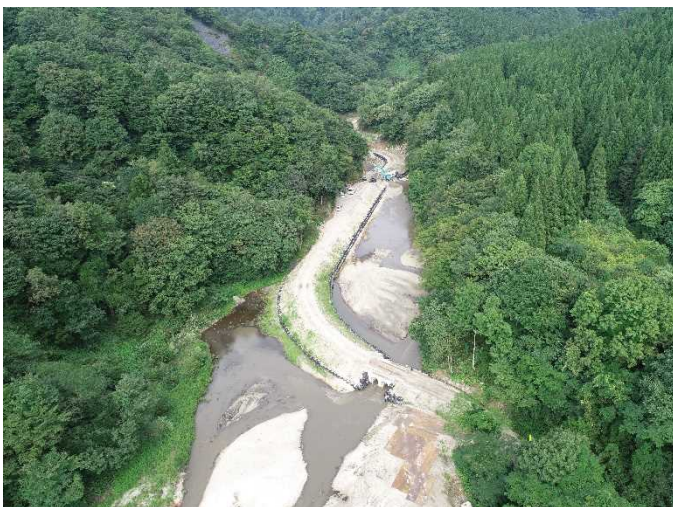
工事用道路下流部 (令和2年8月末現在)