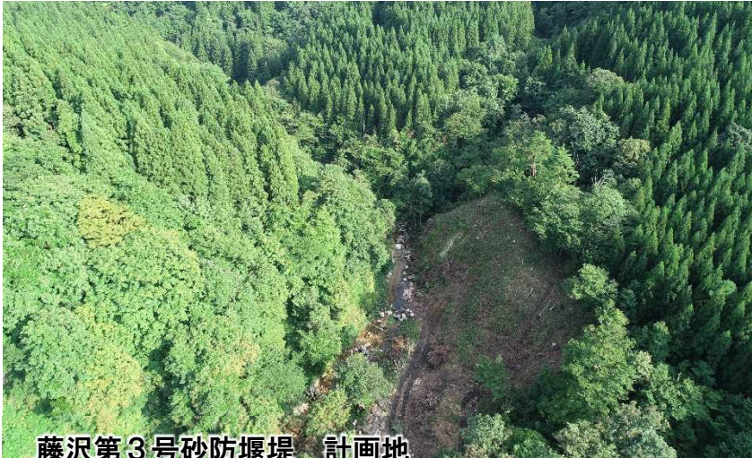
藤沢第3号砂防堰堤 計画地 (下流より 令和2年8月末現在)