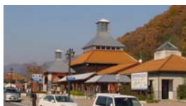
「道の駅」 ゆめランド布野

道の駅において、道路気象情報を提供中です。 また、夜間には道路情報板に県境付近の天 気・気温の予想をお知らせしています。