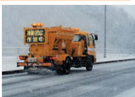
凍結防止剤の散布作業状況