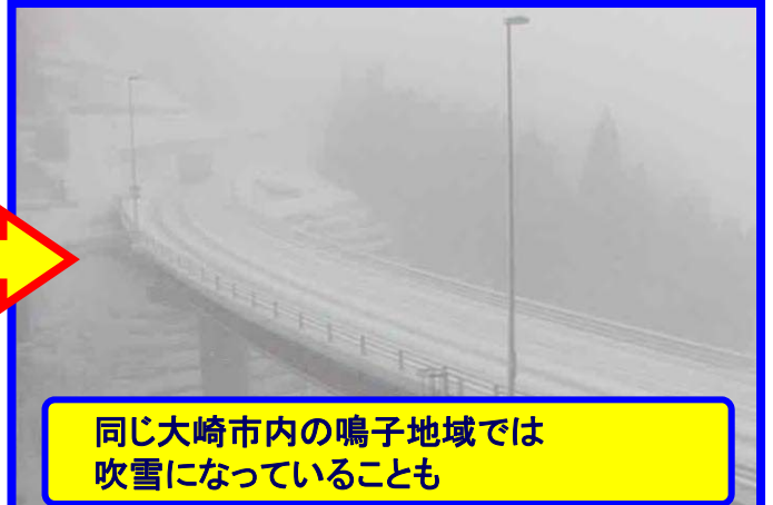
同じ大崎市内の鳴子地域では吹雪になっていることも