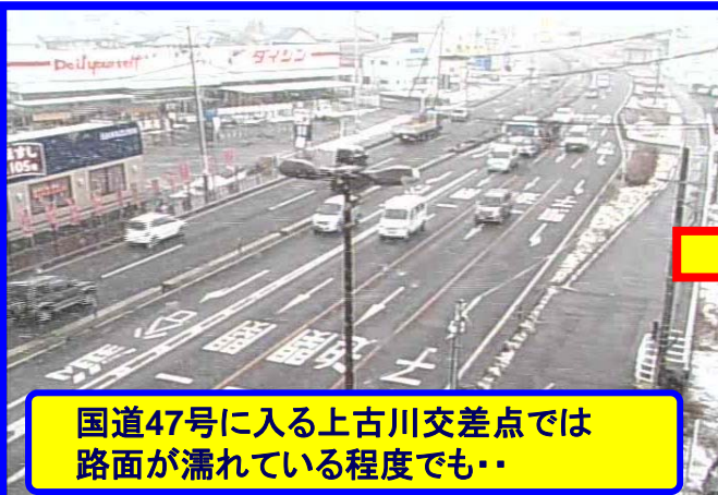
国道47号に入る上古川交差点では路面が濡れている程度でも・・・