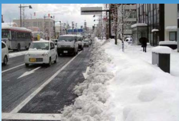
車道と歩道にたまる雪