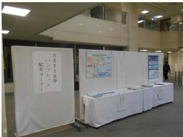
NETISパンフレット配布