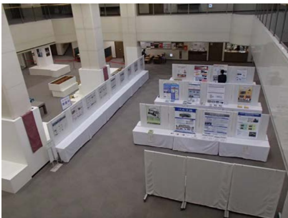
技術パネル等展示コーナー