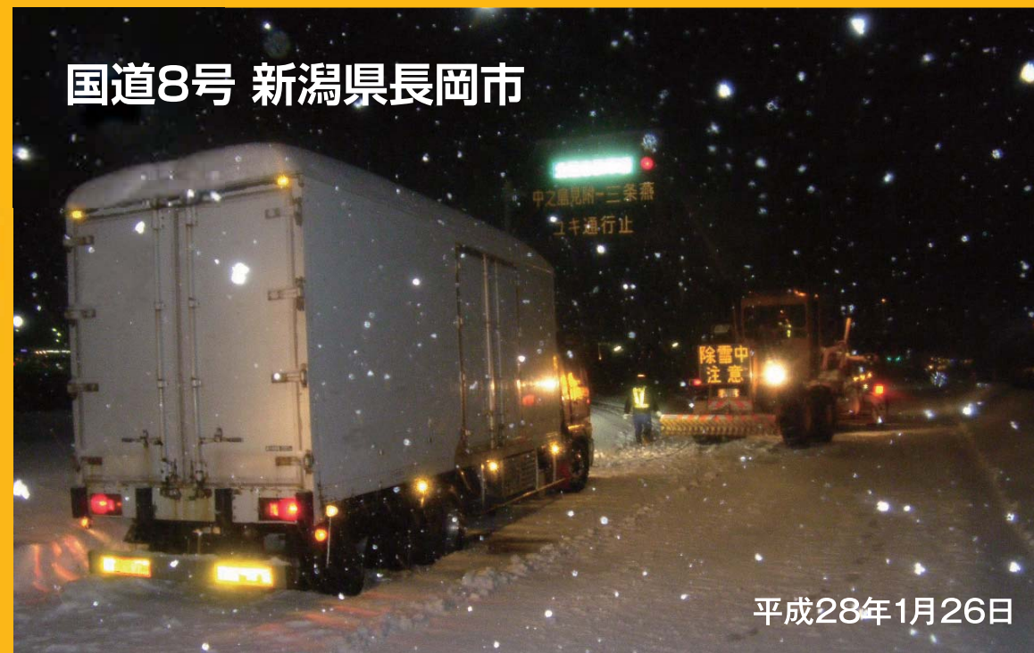
国道8号 新潟県長岡市