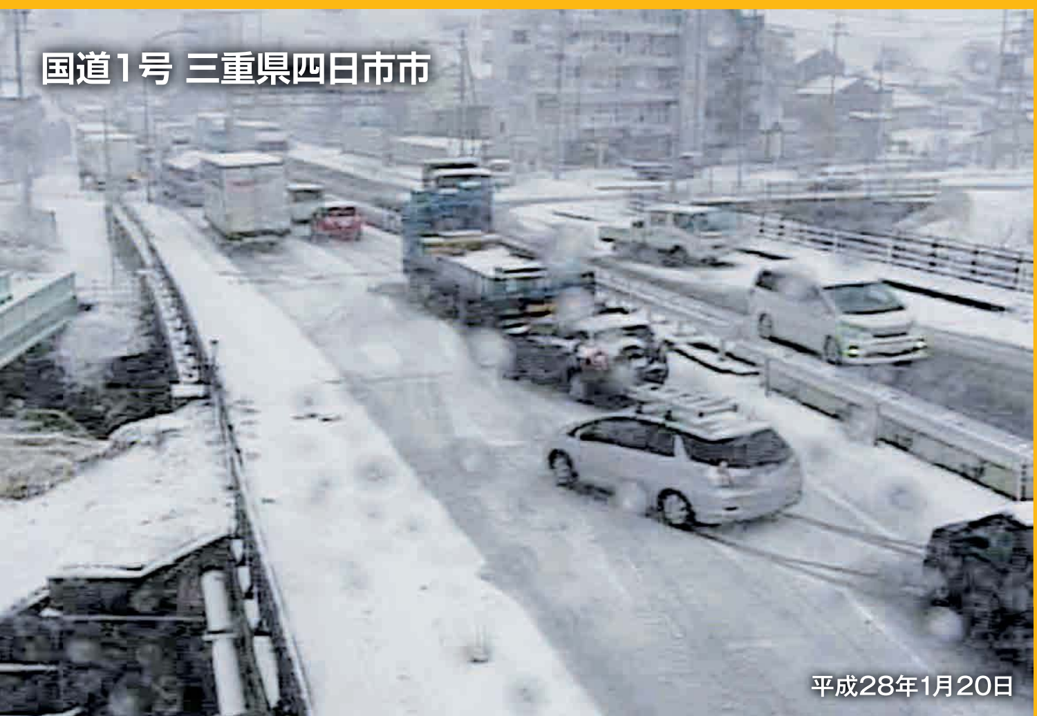
国道1号 三重県四日市市