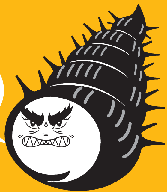
チェーン巻いたん貝

大型車のスリップ・立ち往生をきっかけに、 長時間の通行止めが発生しています。 冬用タイヤへの交換・早めのチェーン装着を よろしくお願いします。