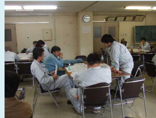
リスクアセスメントの実践訓練