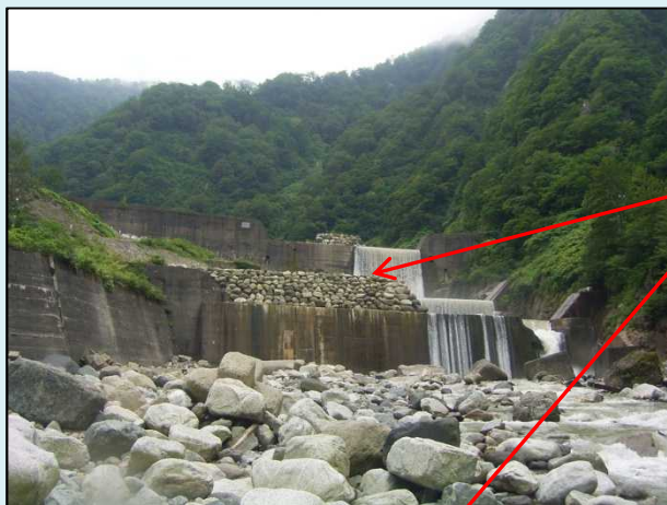
地盤改良工施工ヤード