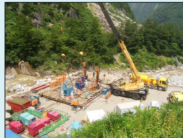
地盤改良工施工状況