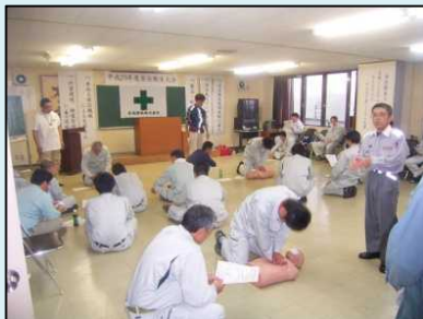
外部講師による講義(救命講習)