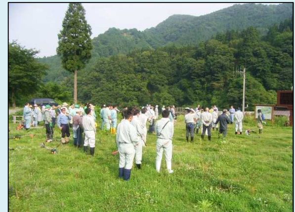
きらきら広場クリーン作戦