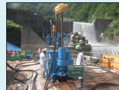
地盤改良工 注入状況