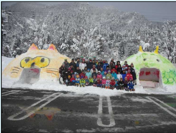
立山山麓かまくら祭り