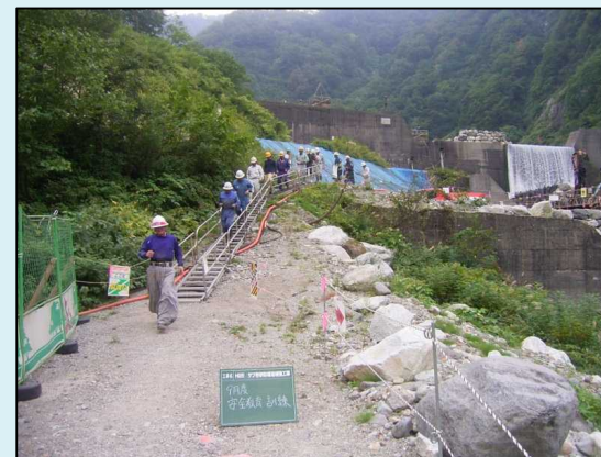
実践訓練(避難訓練)