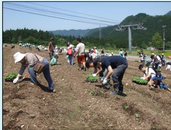
立山山麓花のゲレンデ大作戦