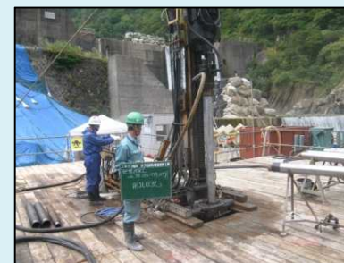
地盤改良工 削孔状況