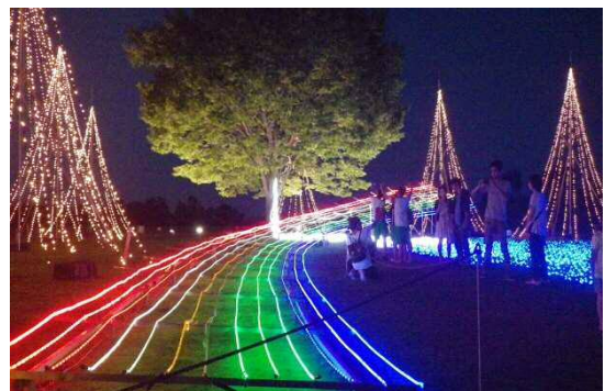
サマーナイトプレゼンツ(8月)