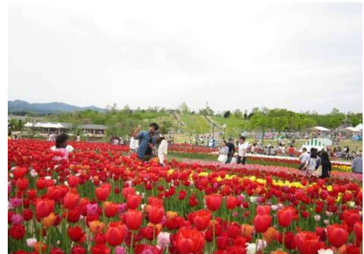
チューリップまつり(5月)

雪割草まつりの他、新たにアイスチューリップを展示するなど、3月は過去最高の28,985人(過去27,762人)を記録!