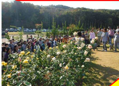
香りのばらまつり・秋(10月)

チューリップまつりなど、5月は過去最高の月別入園者数124,669人(過去103,733人)を記録!