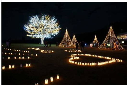
ウインターイルミネーション(12月)