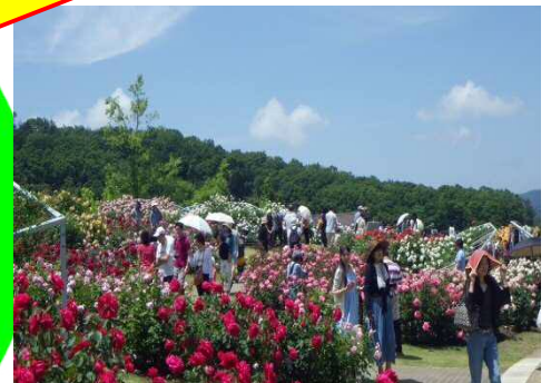
香りのばらまつり・春(6月)

ウインターイルミネーションは、前年度より約62%増。過去3位の49,191人(過去52,133人)!