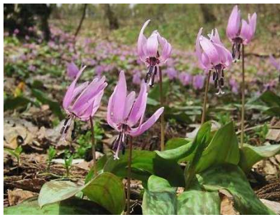
カタクリ (カタクリ大群落)