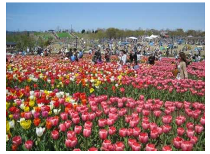
チューリップまつり状況 (花の丘)