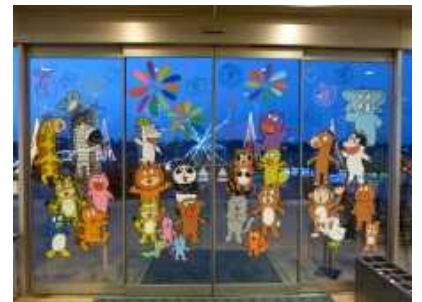
「LOVE NAGAOKA アートプロジェクト」(花火のペイントアート)