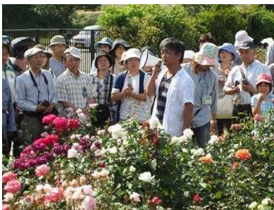
香りのばらまつり状況 (香りのばら園・ガーデンツアー)