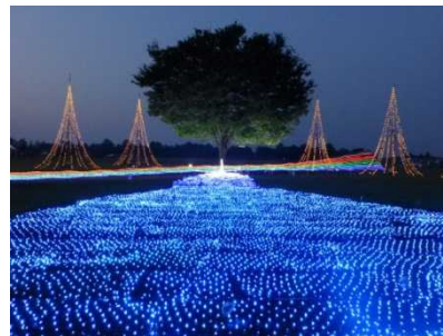
サマーナイトプレゼンツ状況 (緑の千畳敷・イルミネーション)