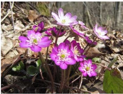
雪割草 (雪割草群落地)