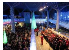
ウインターイルミネーション 状況