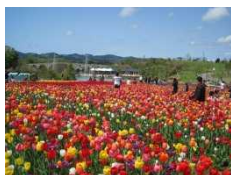
チューリップまつり り状況