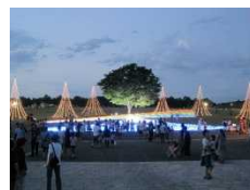
サマーナイトプレゼンツ 状況