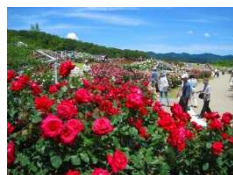
香りのばらまつり り状況