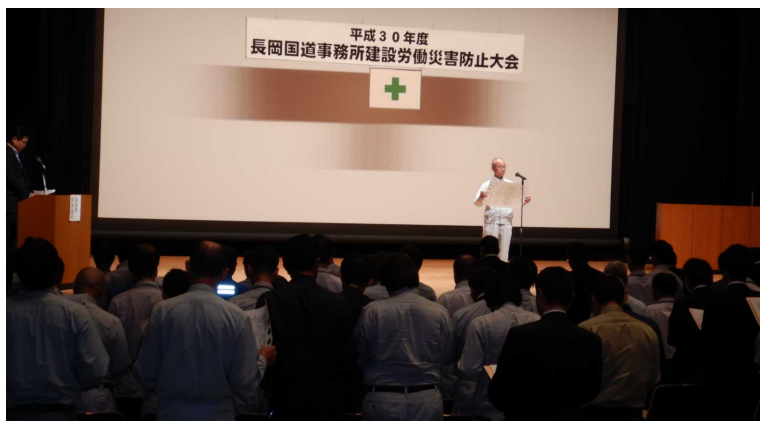
昨年度の建設労働災害防止大会(安全宣言)