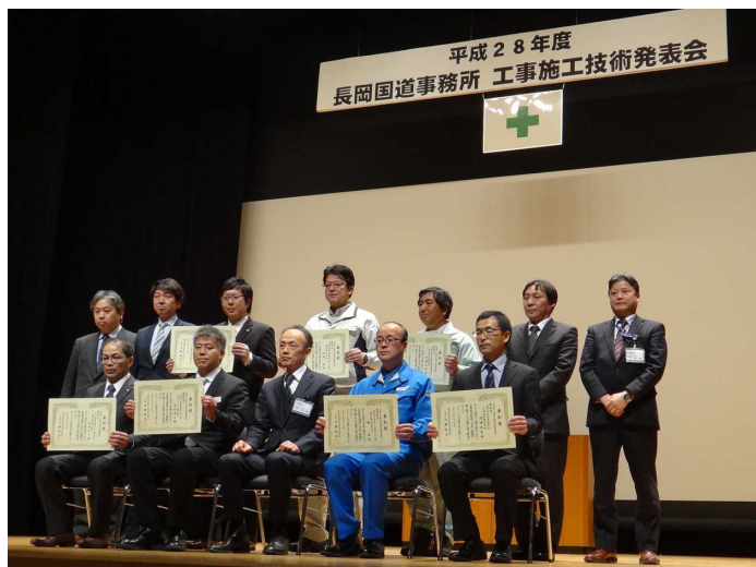
【昨年度の開催状況】