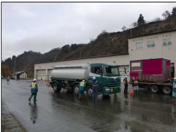
「冬用タイヤ装着・チェーン携行調査」の状況