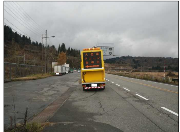
「チェーン装着指導周知」の状況