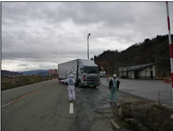
「チェーン装着指導（引き込み）訓練」の状況