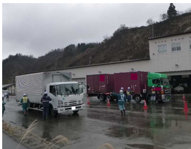
「冬用タイヤ装着率調査」の様子