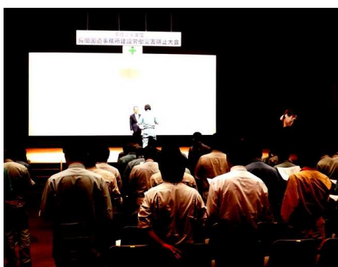
昨年度の建設労働災害防止大会