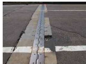
【橋面伸縮装置の欠損状況】