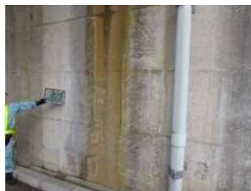
【橋台部のコンクリートひび割れ状況】