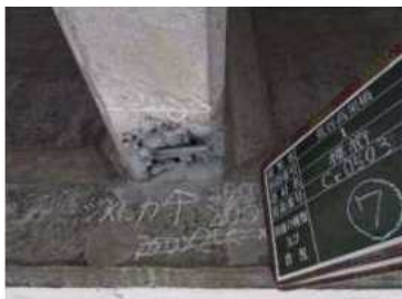
【主桁端部のコンクリート欠損状況】