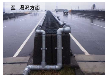
池之島高架橋（上り・下り）