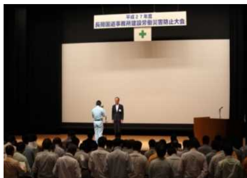
昨年度の建設労働災害防止大会