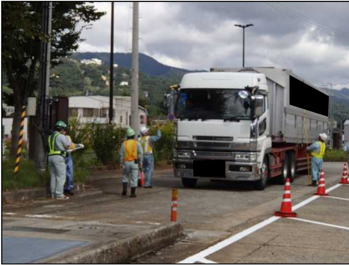
国道17号 塩沢道路ステーションの取締状況