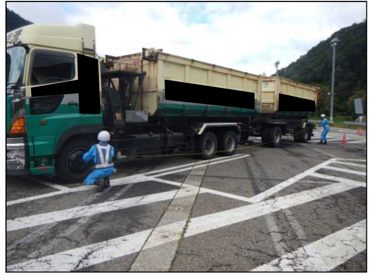
関越自動車道 土樽パーキングエリア(上り線) の取締状況