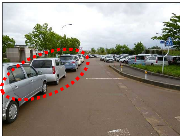
【駐車状況写真: 工事前】