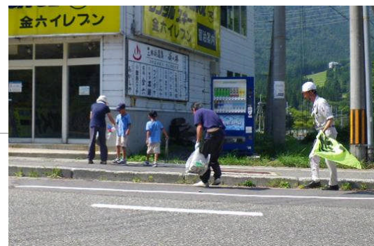
昨年度の様子 (家族連れでの参加もあり)

このクリーン作戦は、長年にわたり国道の美化活動に取り組まれている浅貝町内会の皆様の協力を得て、平成7年より実施しており、浅貝町内会の皆様からは毎回50名程度参加していただいています。