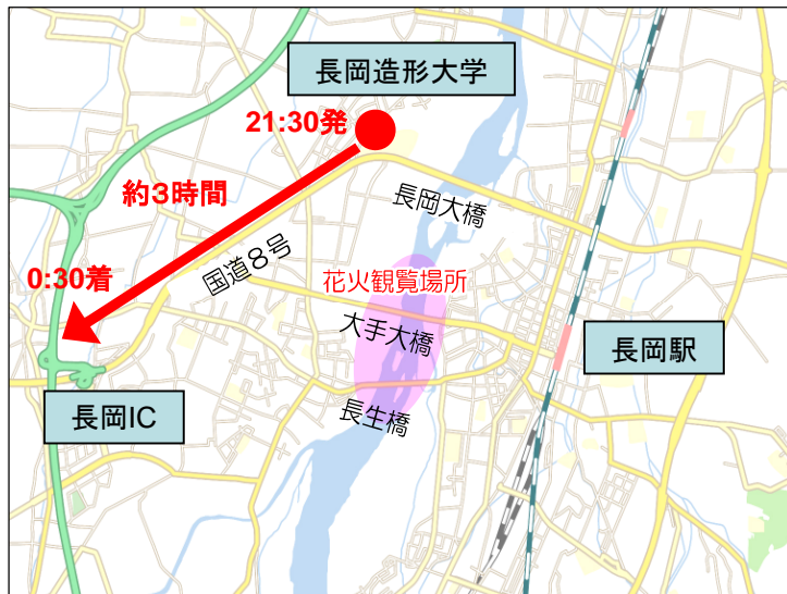
長岡IC付近の渋滞状況 (22:00頃)