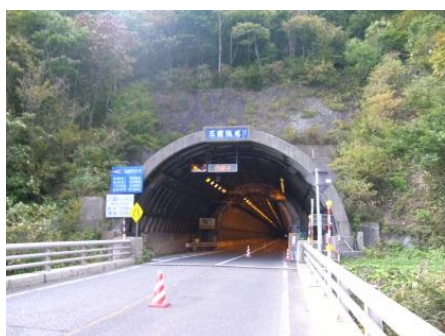
三国トンネル(群馬側)