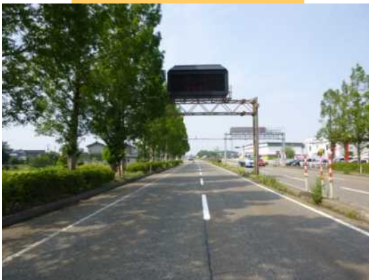
中之島 道路情報板(取替前)