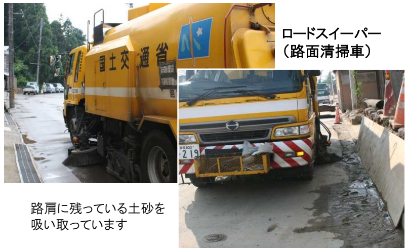
ロードスイーパー (路面清掃車)