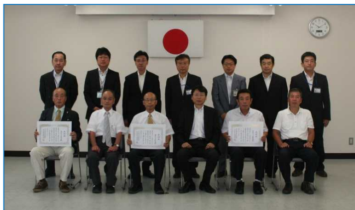
受賞の皆さんと記念撮影

http://www.hrr.mlit.go.jp/chokoku/pdf/130827_nagaoka.pdf