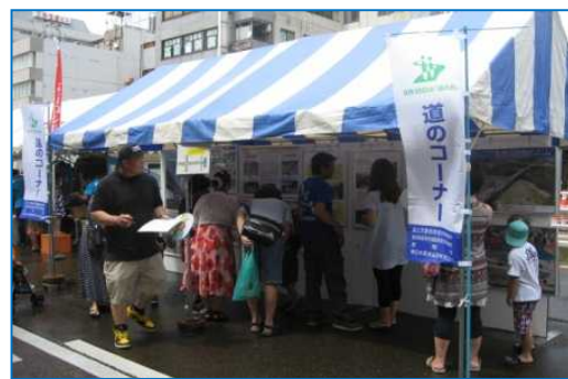
「道に関するパネル展示とクイズコーナー」