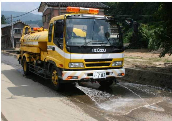
散水車 路面に残った細かな土砂を洗い流しています

長岡市からの要請により、生活道路である市道(580m)の土砂除去作業を支援しました。