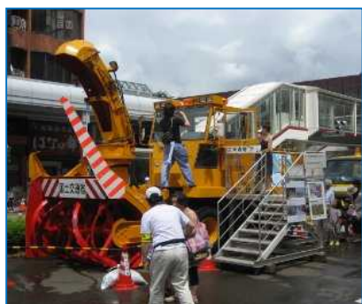
ロータリー除雪車(左)と高所作業車(右)の展示・試乗

8月の「道路ふれあい月間」関連行事として、長岡まつり昼行事で実施された「わんぱくおまつり広場」に、長岡国道事務所・長岡地域振興局・長岡市・NEXCO東日本長岡管理事務所・北陸地域づくり協会で「道のコーナー」を出展しました。 【管理第一課】