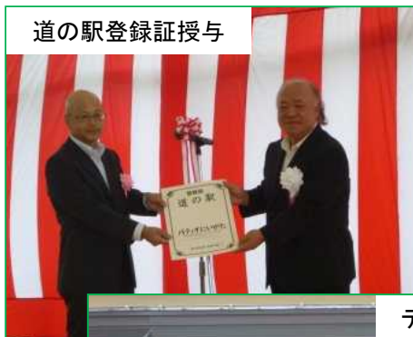
道の駅登録証授与