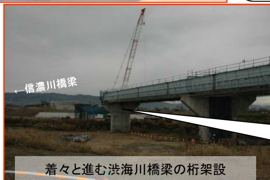
着々と進む洩海川橋梁の桁架設