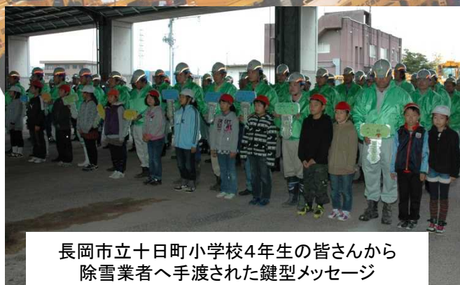
長岡市立十日町小学校4年生の皆さんから 除雪業者へ手渡された鍵型メッセージ

126台の除雪車両で「常時2車線以上の幅員確保」を目標に、11月1日から「道路雪害対策支部」を設置し、来春までの約半年間に及ぶ、24時間の除雪体制に入りました。【管理第一課】