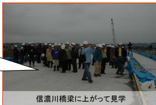
信濃川橋梁に上がって見学