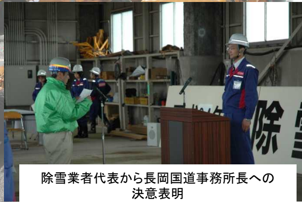
除雪業者代表から長岡国道事務所長への 決意表明