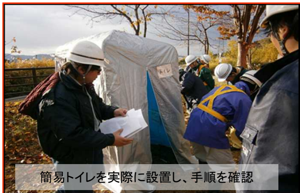
簡易トイレを実際に設置し、手順を確認

当日は、小千谷市、道の駅指定管理者(市の道の駅管理運営委託業者)、長岡国道事務所から19名が参加し、簡易トイレを実際に設置し作業手順を確認したり、資材倉庫を点検し備品の内容・保管状態など、災害時に備え確認を行いました。 【小出維持出張所】