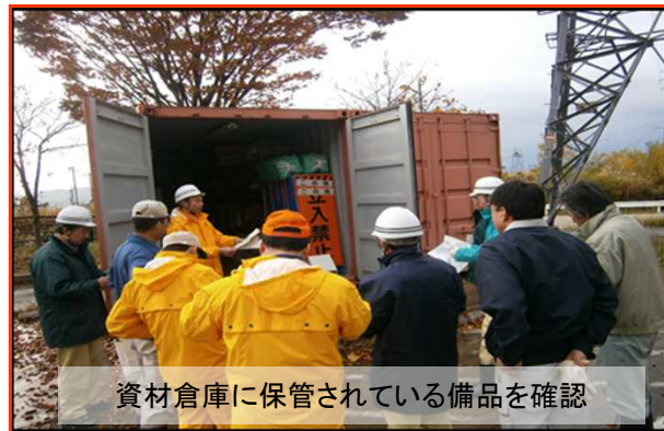
資材倉庫に保管されている備品を確認