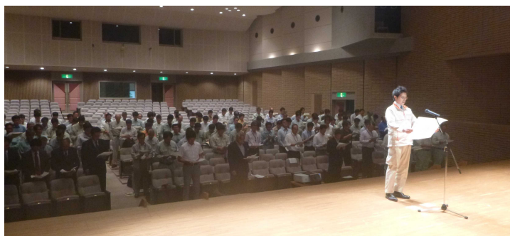
昨年度の建設労働災害防止大会