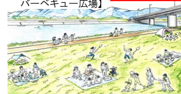
【デイキャンプ・バーベキュー広場】 利用イメージ