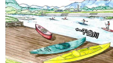
【カヤック・SUP乗り場】 利用イメージ