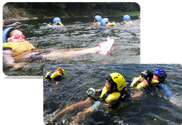
川の中での姿勢を学ぶ