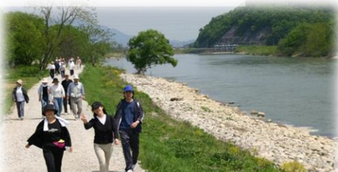
管理用通路をフットパスとして活用 (最上川/長井市)