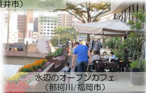
水辺のオープンカフェ (那珂川/福岡市)