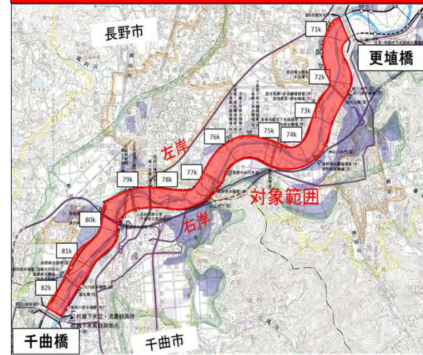
範囲図⑦【更埴橋～千曲橋の河道内】