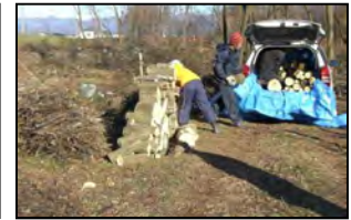
当選者による伐採作業の様子