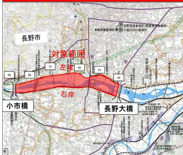
範囲図⑧【長野大橋～小市橋の河道内】