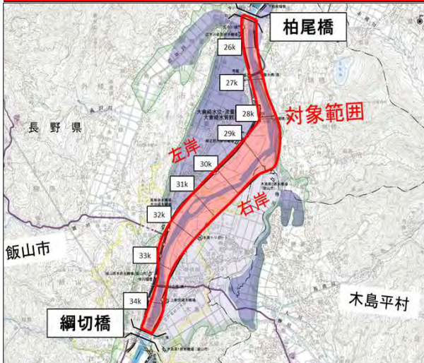
範囲図④【柏尾橋～綱切橋の河道内】