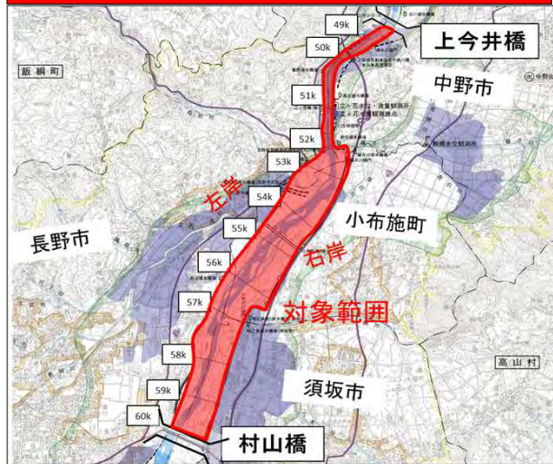
範囲図⑤【上今井橋～村山橋の河道内】